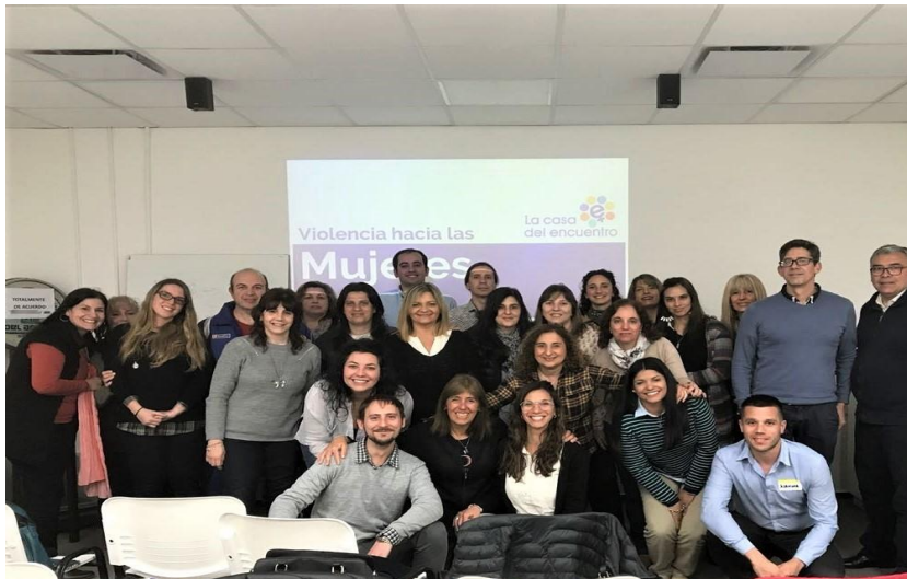
Capacitación en violencia de género junto a La Casa del Encuentro.